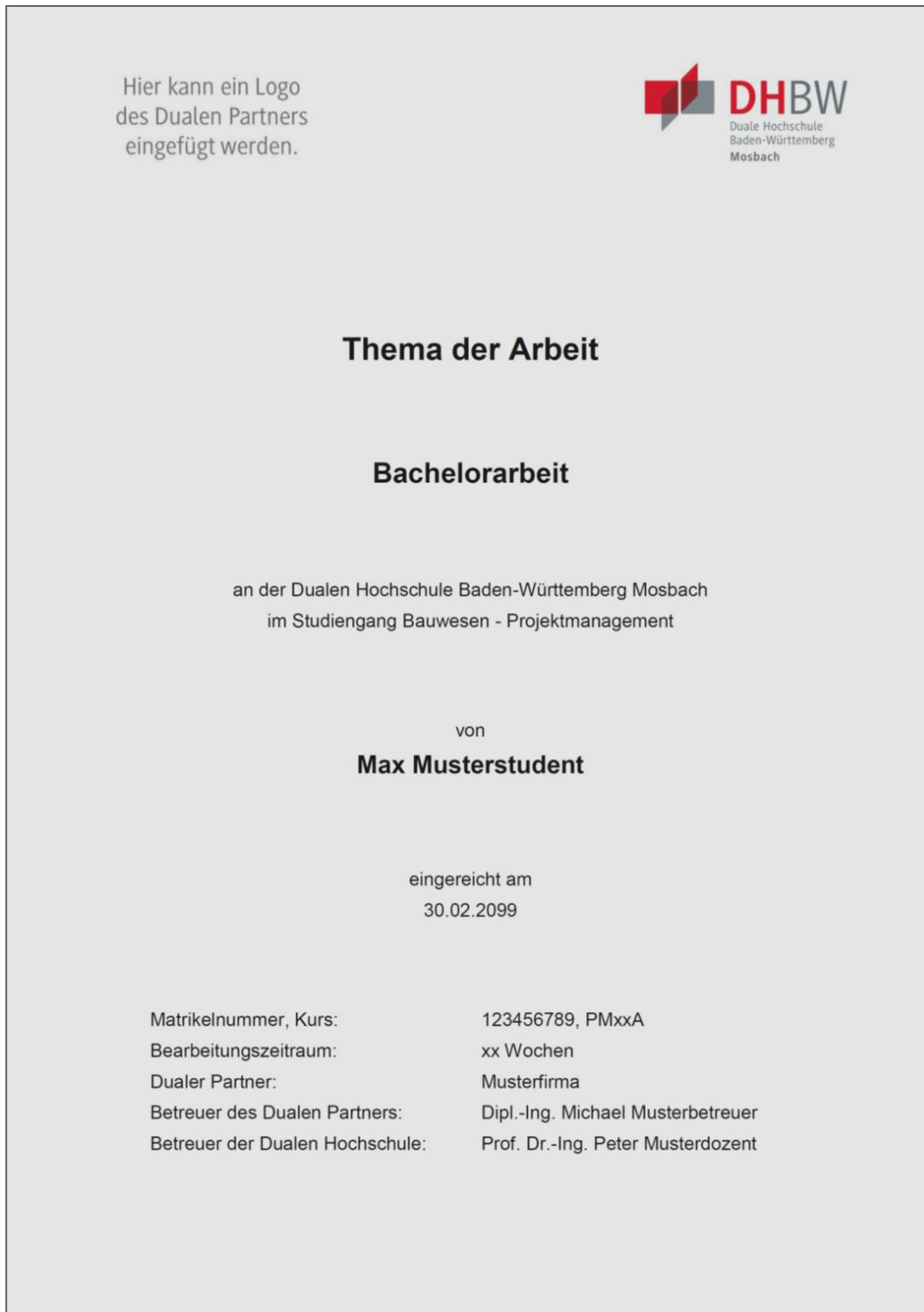
Abbildung 2-2: Vorlage für das Deckblatt

Auf dem Deckblatt sind die Eckdaten zur Arbeit aufzulisten. Es ist gemäß der nachfolgenden Abbildung 2-2 aufzubauen und steht als Vorlage auf der Homepage der DHBW zum Download bereit. Das Deckblatt ist nicht Bestandteil des Inhaltsverzeichnisses.