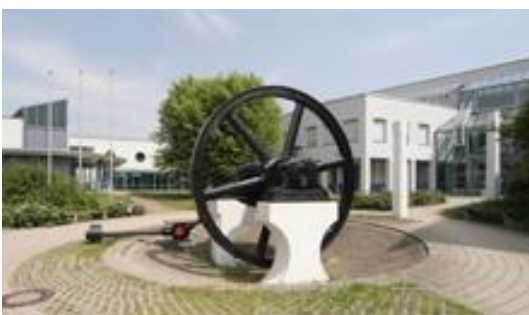
Abbildung 2-7: DHBW Mosbach (Duale Hochschule Baden-Württemberg [3])

Bei Abbildungen ist nicht zu unterscheiden zwischen Fotos, Diagrammen oder Zeichnungen.